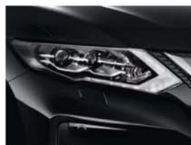
Black - P - G41