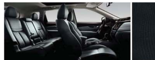
TECIDO TIPO CAMURÇA