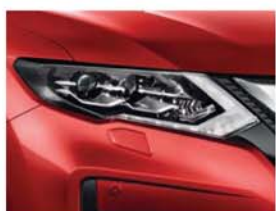
Tinted Red - CP - NBF