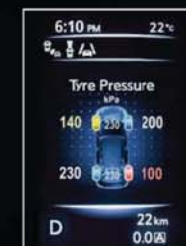
SISTEMA DE MONITORIZAÇÃO DA PRESSÃO DOS PNEUS