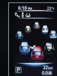
COMBINE O ECRÃ À SUA COR