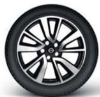
Jantes em liga leve de 19"