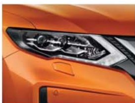
Orange - PM - EBB