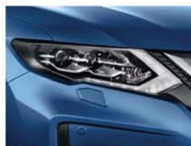
Blue - PM - RAW