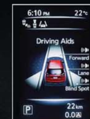
ASSISTENTES DE CONDUÇÃO