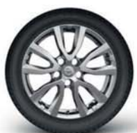
Jantes em liga leve de 17"