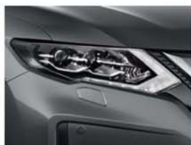
Grey - M - KAD