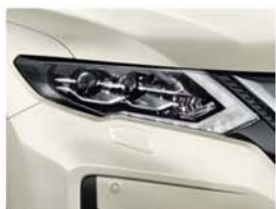
White - 3P - QAB