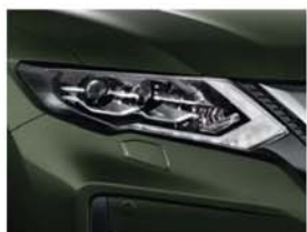
DK Olive - PM - EAN