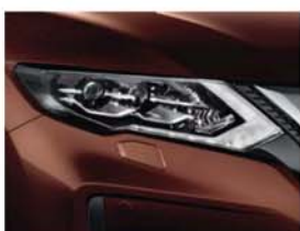
DK Brown - P - CAS