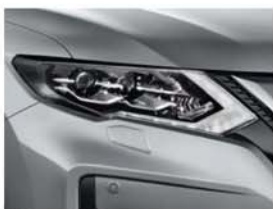
Silver - M - K23