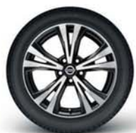
Jantes em liga leve de 18"