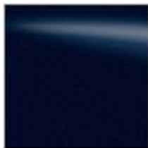
BW9 AZUL (M)