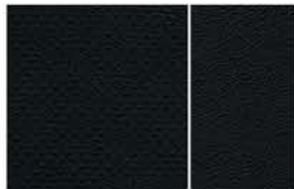
TEKNA OPTION - PELE GRAPHITE