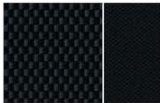
ACENTA - TECIDO GRAPHITE