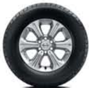
Liga leve de 16"