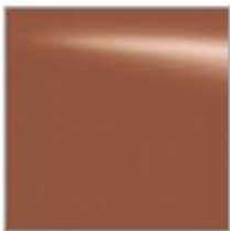
CAQ BRONZE TERRA (M)