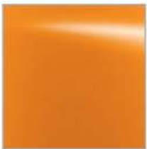
EAU AMARELO SAVANA (M)