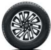
Liga leve de 18"