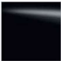
GN0 PRETO (M)