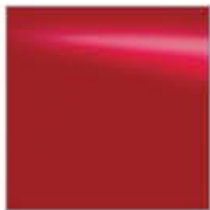
Z10 VERMELHO (S)