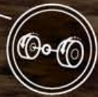
Bloqueio Eletrónico do Diferencial Traseiro