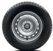
Tampões de jantes de 16"