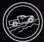
Assistência ao Arranque em Subida

Seja na profundidade do campo ou no campo ou no asfalto da cidade, a nova Nissan NP300 Navara sente-se sempre bem integrada. Possui três modos de condução - 4x4 altas para uma condução fora-de-estrada pouco exigente, 4x4 baixas para uma condução fora-de-estrada sobre areia, neve ou lama, ou 4x2 para asfalto. Com equipamentos como o arranque assistido em subidas e o Controlo Assistido em Descidas, esta pick-up está pronta para o que der e vier, com uma excelente tração até a 2 rodas, graças ao eLSD.