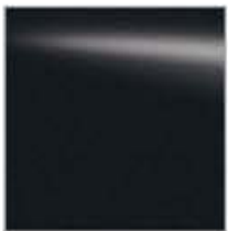
K51 CINZENTO (M)