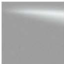
KL0 PRATEADO (M)