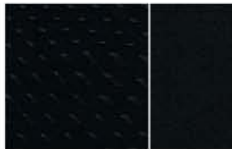
N-CONNECTA - TECIDO GRAPHITE